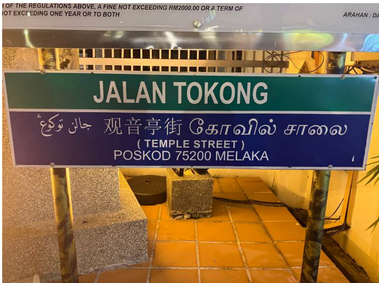
Panneau multilingue, Melaka, Malaisie (U. Veluppillai, 2024)

Modalités de contrôle des connaissances spécifiques aux L.AS : https://www.Inalco.fr/formations/licence-las