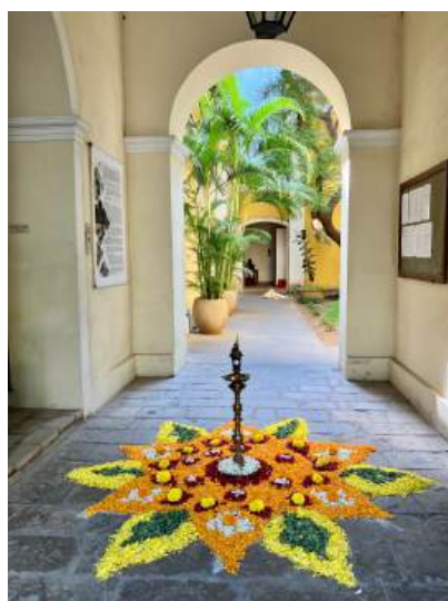
Kōlam de fleurs, Pondichéry (U. Velupillai, 2023)