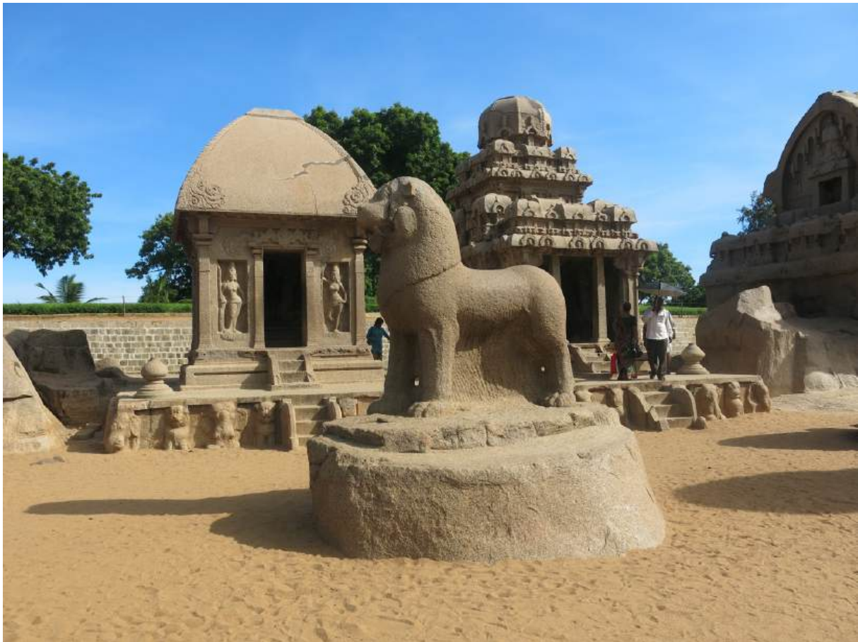
Monuments monolithiques de Mahābalipuram (U. Veluppillai, 2014)