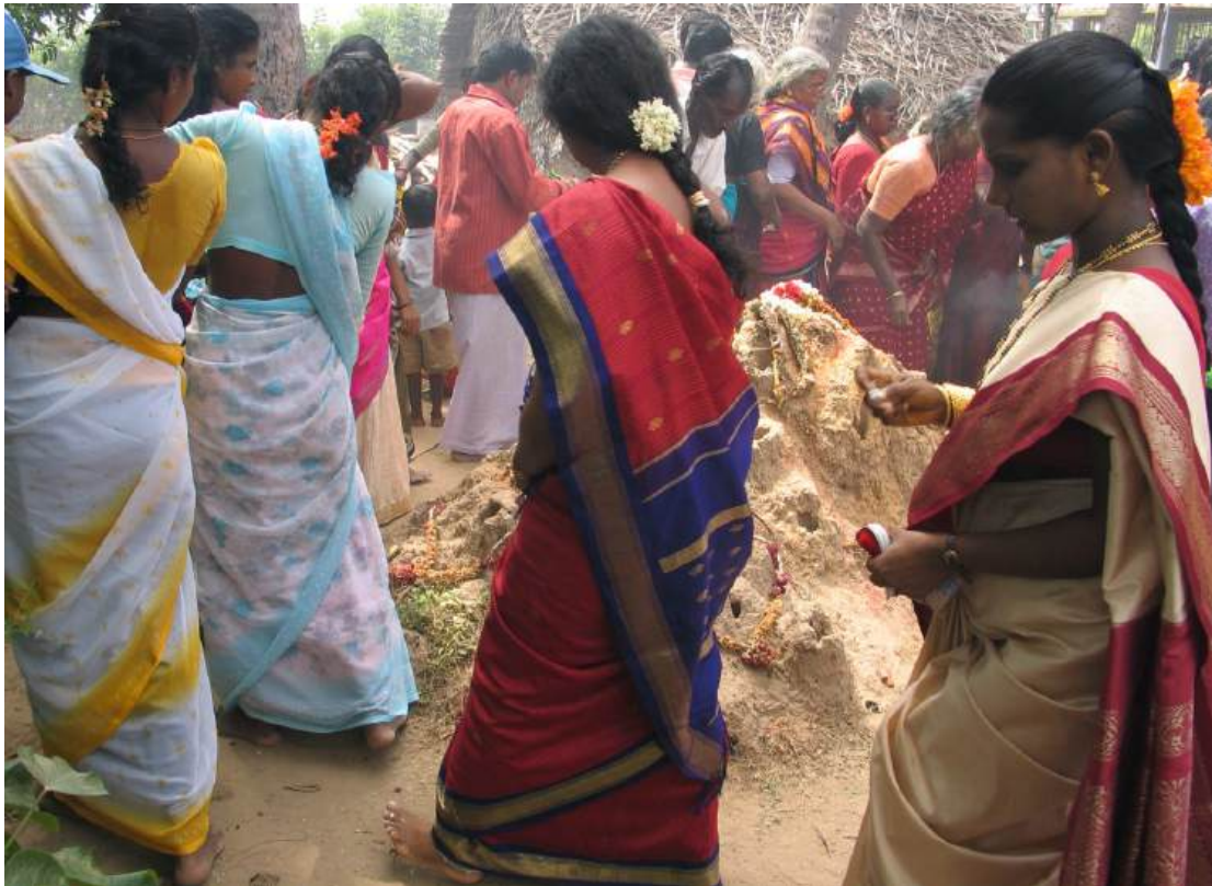
Scène de culte, Cīrkāḷi (U. Velupillai, 2006)

Évaluation : CC : examen écrit en cours de semestre (50%) et examen écrit en fin de semestre (50%). CT : examen écrit en fin de semestre sur l'ensemble du cours.