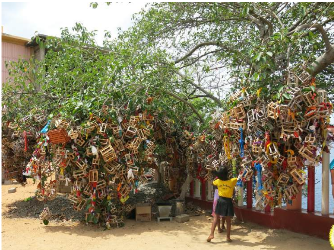
Arbre à vœux sur lequel sont attachés des berceaux miniatures, Tirukōṇamalai, Sri Lanka

Uthaya VELUPPILLAI pour la langue tamoule, uthaya.velupillai@inalco.fr