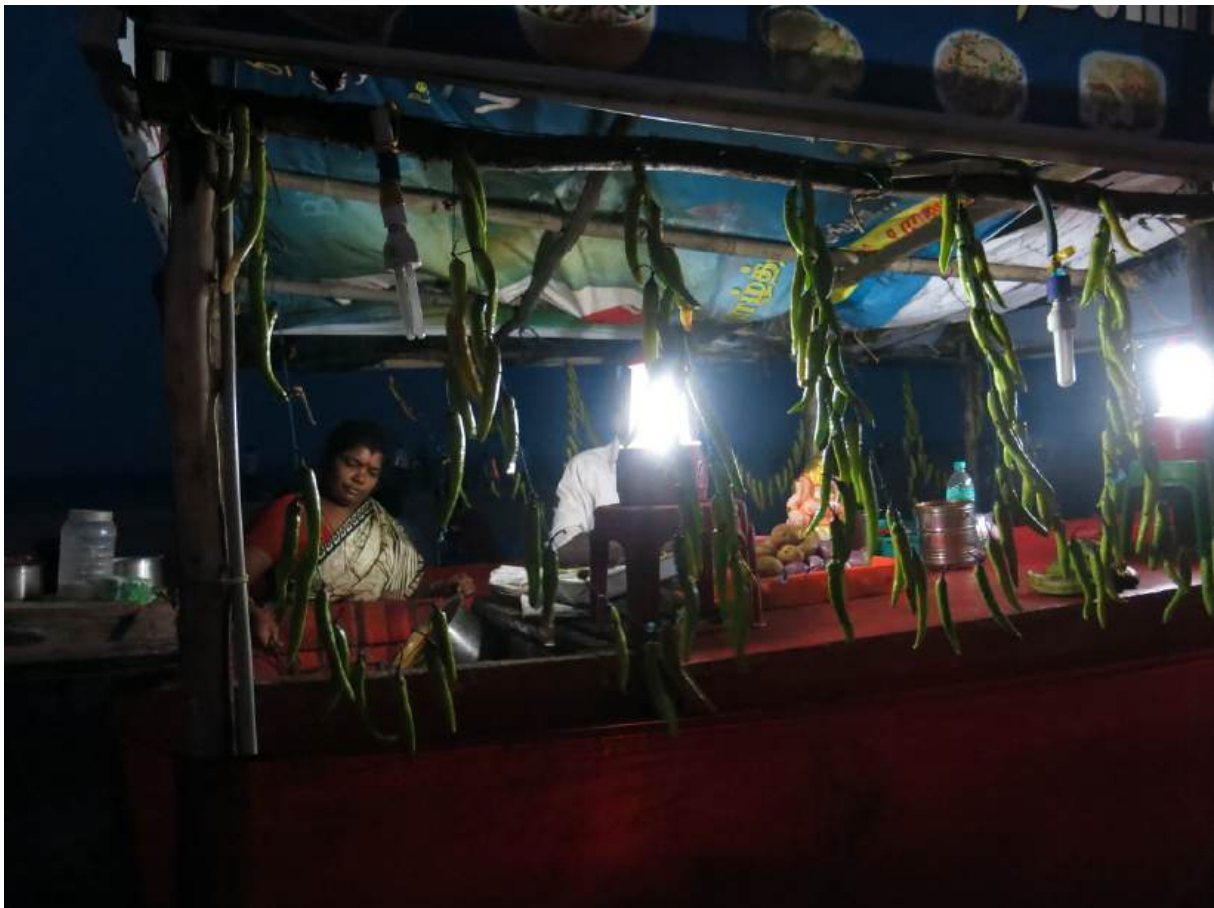
Vendeurs de bajji, Cennai (U. Veluppillai, 2014)