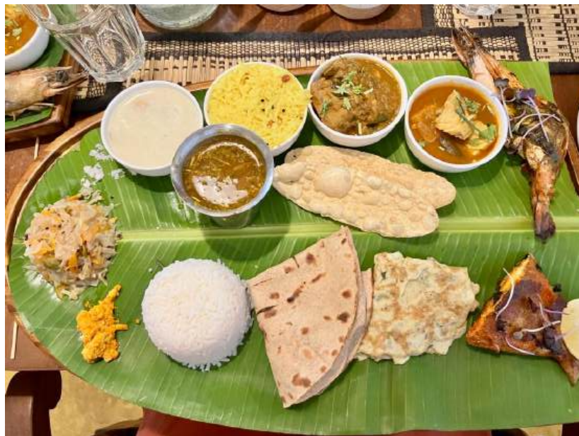
Repas servi sur feuille de bananier, Pondichéry (U. Veluppillai, 2023)

https://www.Inalco.fr/actualites/ ou https://www.Inalco.fr/agenda