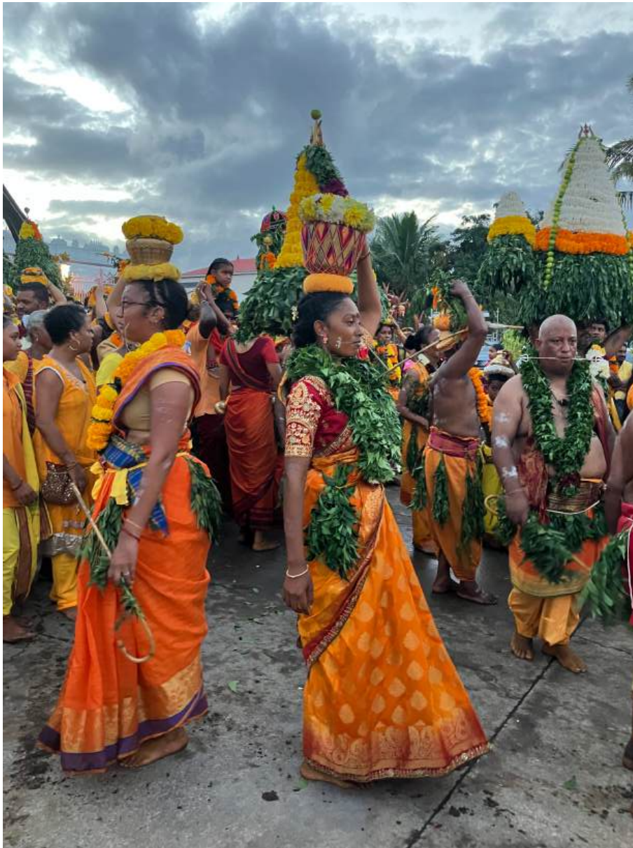
Macération lors de la fête du nouvel an tamoul, Sainte-Rose, La Réunion (U. Velupillai, 2025)

Les étudiants peuvent bénéficier d'une aide au voyage de l'Inalco, en vue d'effectuer un séjour en immersion et de découverte d'un pays dont la langue est étudiée durant le parcours universitaire effectué à l'Inalco, pendant les vacances d'été. Cette aide, octroyée sous certaines conditions, finance les coûts de transport vers le pays de destination. Pour plus de renseignements, consulter le site de l'Inalco : https://www.Inalco.fr/aide-au-voyage