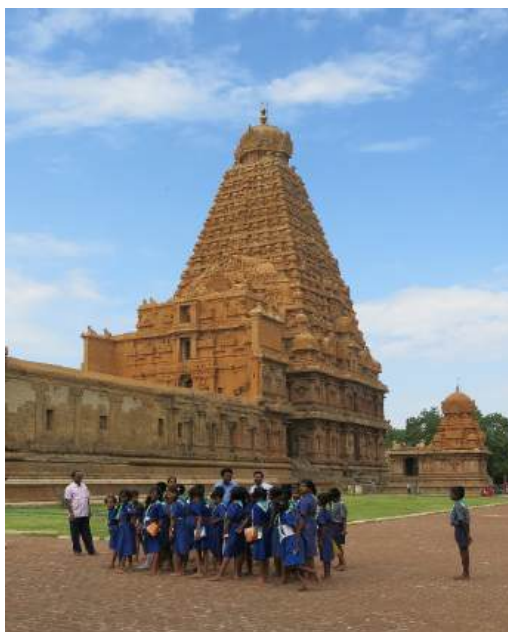
Temple de Brhadīśvara, Tañcāvūr (U. Velupillai, 2014)

Brochure non contractuelle, à jour au 02 février 2026. Des modifications sont susceptibles d'intervenir d'ici la rentrée.