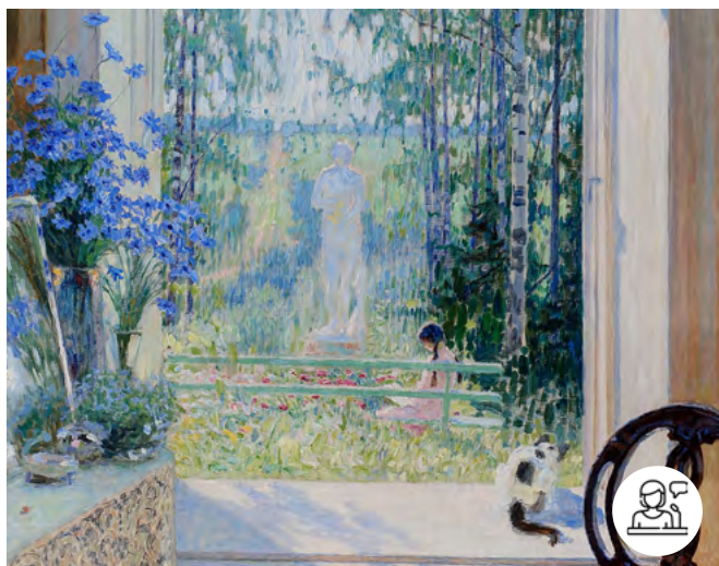
Nikolaï Bogdanov-Belski, L'été (1911) © Musée de l'impressionnisme russe

19 juin - 9h30-17h30 Pôle des langues et civilisations - salle 3.11