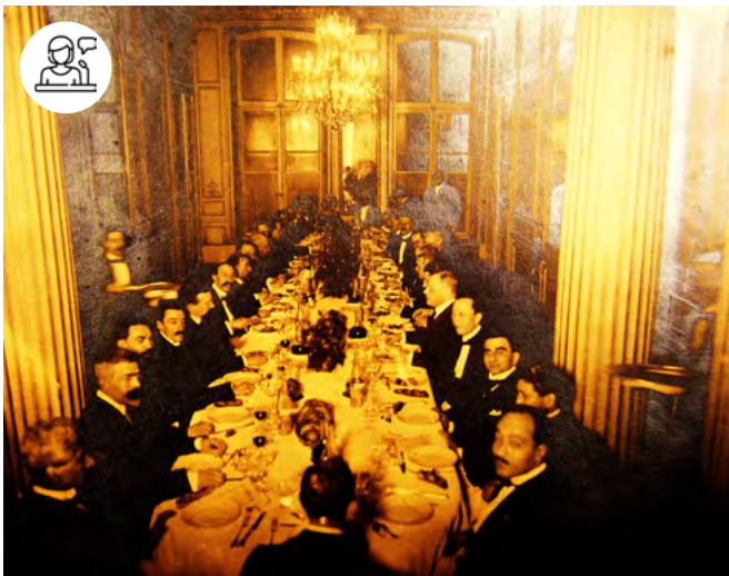
Dîner de l'École des LL.O.V. 1er février 1923

19 juin - 9h-17h30 Maison de la recherche - Salon Borel