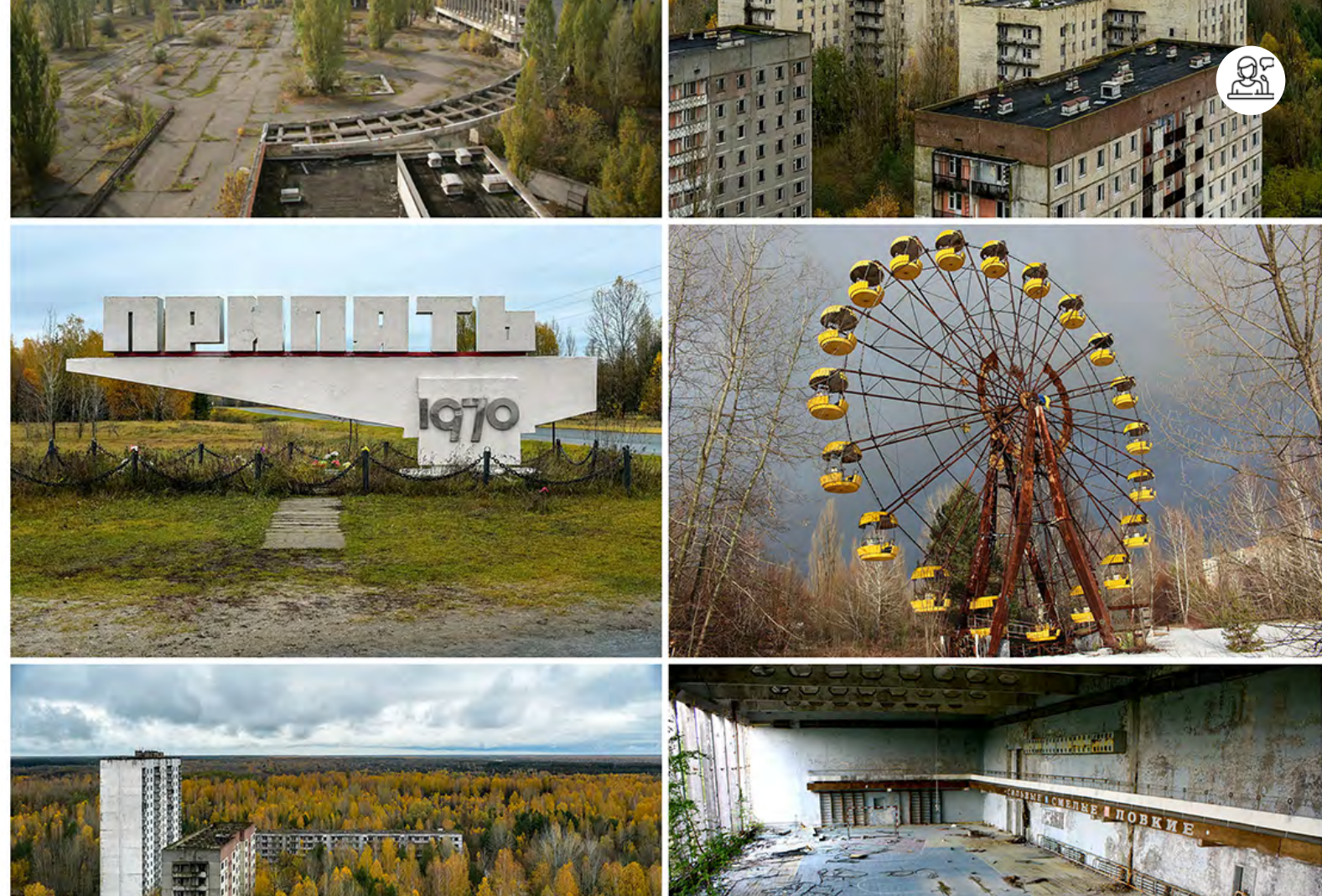
Montage photo de Pripyat

4 juin - 14h30-18h20 - Maison de la recherche - Auditorium 5 juin - 9h45-17h30 - Pôle des langues et civilisations - Salle 3.05