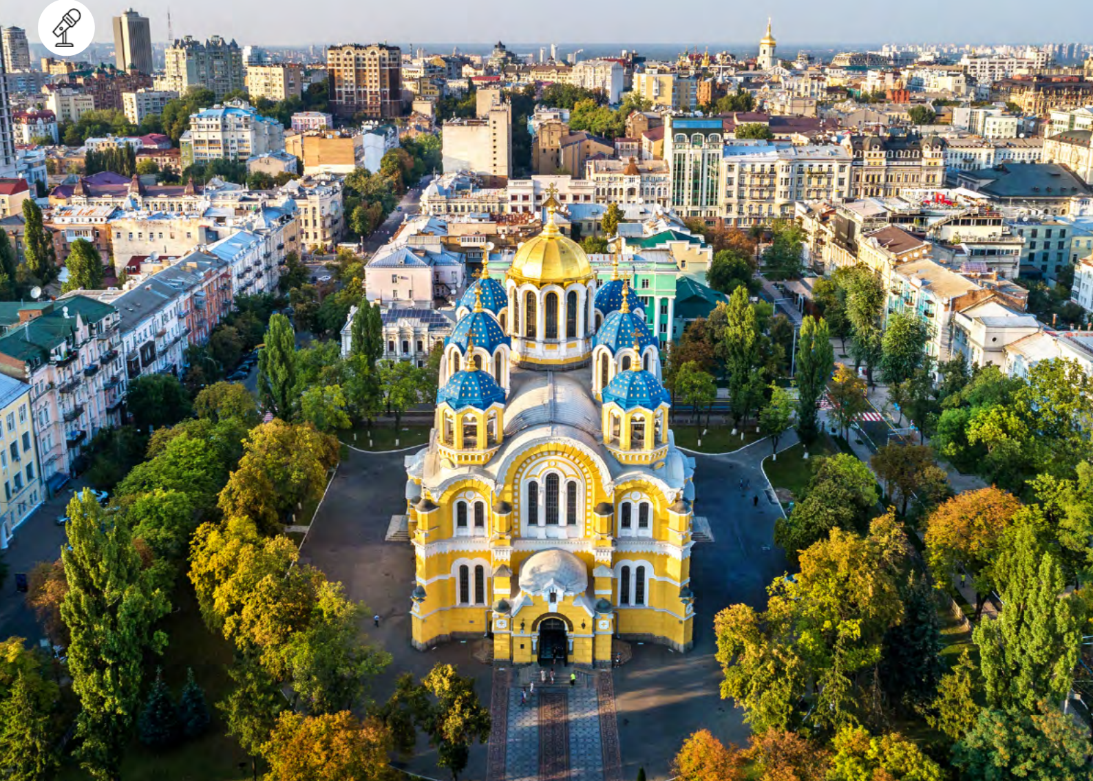
L'Église orthodoxe ukrainienne - patriarcat de Kiev © Libre de droits