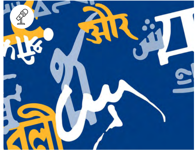
Écritures orientales

5 juin - 15h-17h Pôle des langues et civilisations - salle 4.17