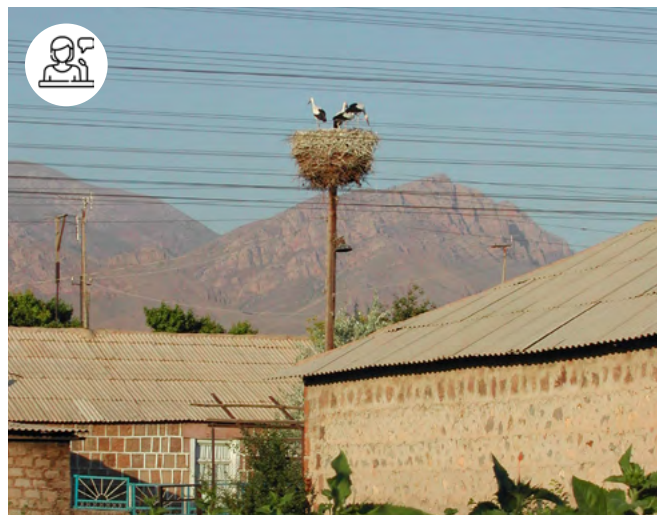
Nid de cigognes, Arménie

Programme complet sur www.inalco.fr/agenda Entrée libre.