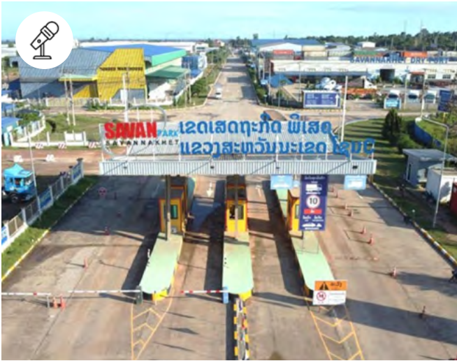
Zone Economique Spéciale de Savan-Seno

3 juin - 18h30-20h Pôle des langues et civilisations - salle 3.12