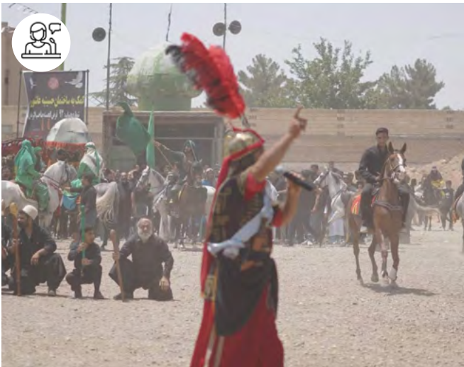
Ta'zieh de Jong e 'ashura, Falavarjan – Iran, 2023