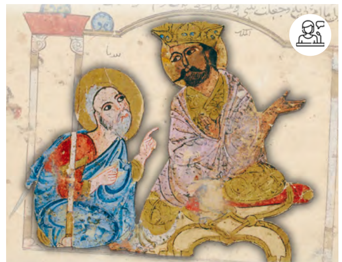
Illustration tirée de Kalila wa-Dimna, mentionné par Averroès dans son Commentaire à la Poétique, MS Arabe 3465, f. 15v

Programme complet sur www.inalco.fr/agenda Entrée libre.