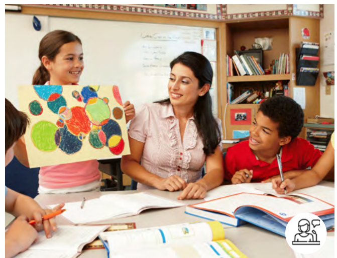
Classe inversée

Programme et inscription sur www.inalco.fr/agenda