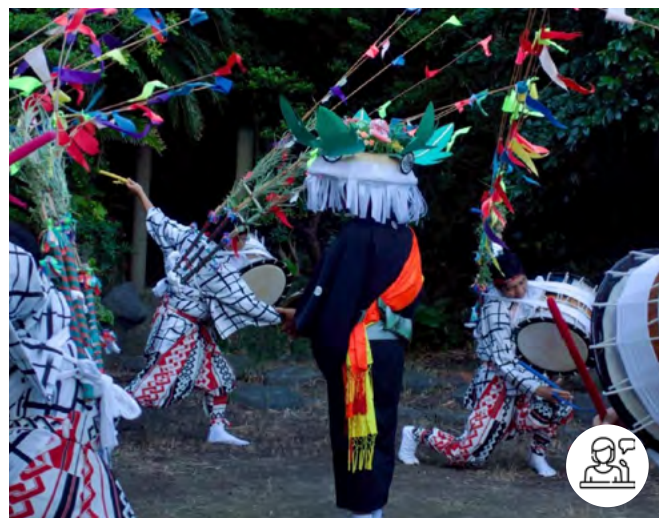
Hassaku taiko odori de l'île d'Iô