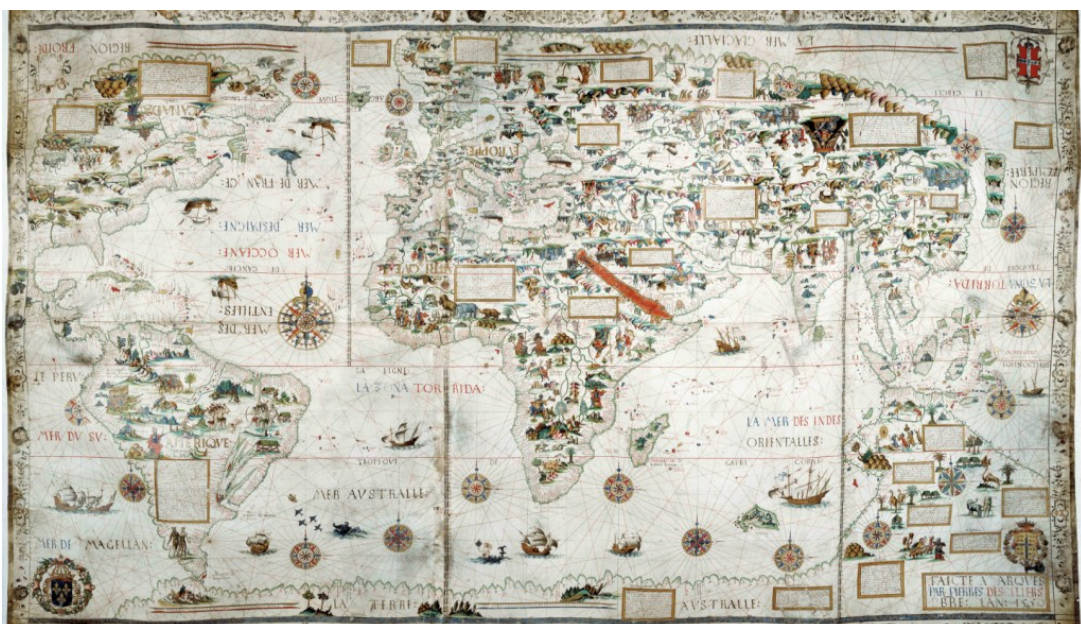
Carte du monde de 1550, de Pierre Desceliers, BRITISH LIBRARY BOARD, ADD. 24065

Il poursuit en partie les questionnements du parcours "Histoire connectée du monde" de licence.