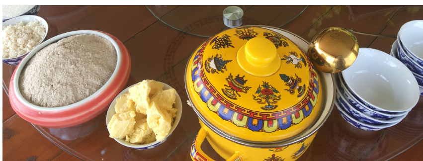
Fromage séché, tsampa et beurre, août 2023