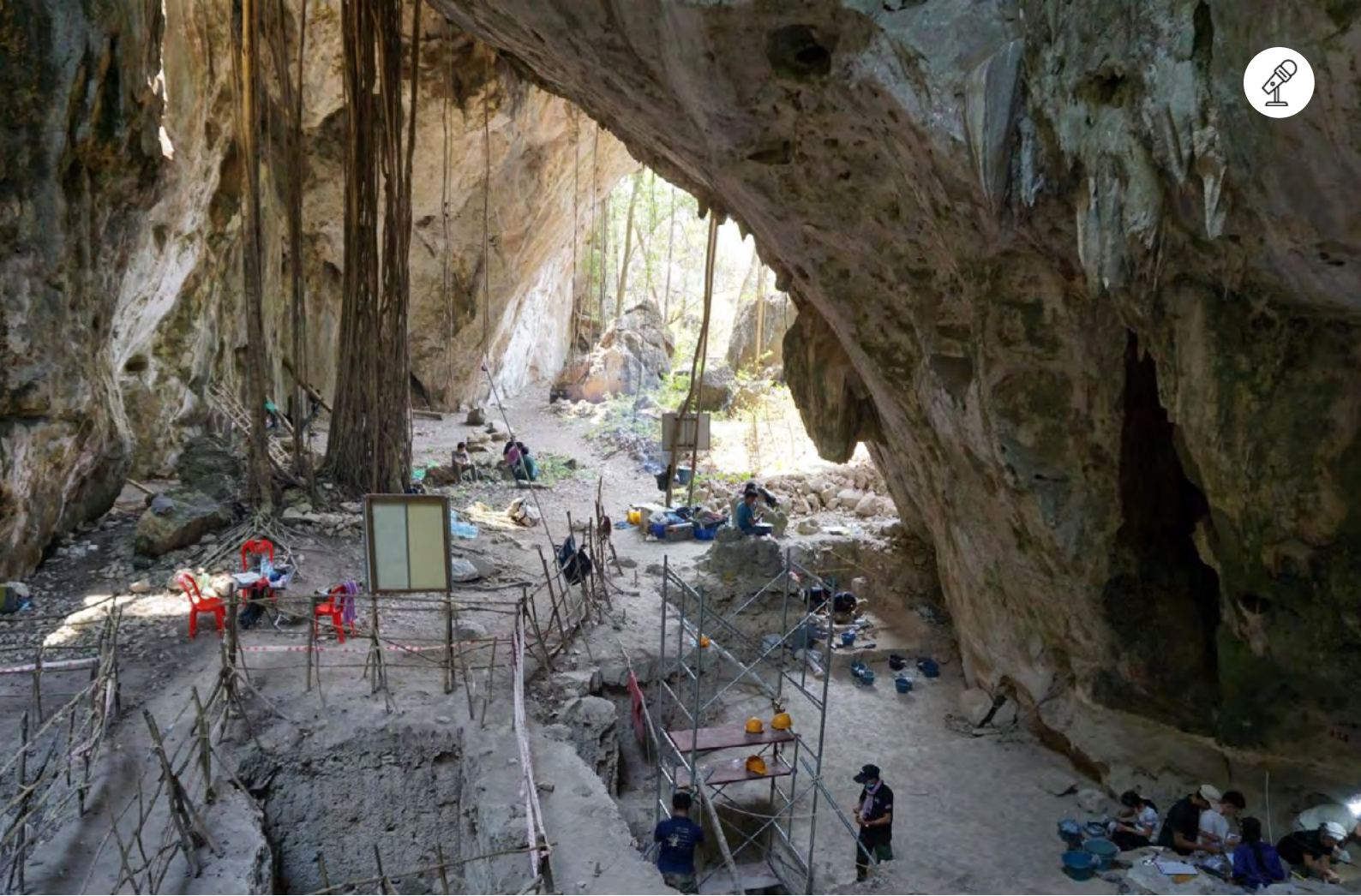
Fouilles de la grotte de Laang Spean ou « grotte des ponts » (Province de Battambang)