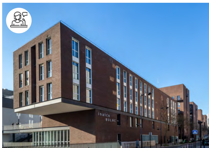
Pôle des langues et civilisations

23 janvier - 8h30-19h / 24 janvier - 9h-18h10 Pôle des langues et civilisations - Auditorium