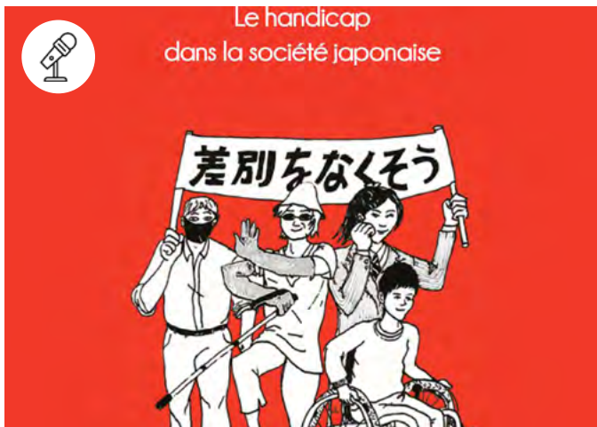
Couverture de l'ouvrage Le cœur et le droit. Le handicap dans la société japonaise d'Anne-Lise Mithout

13 janvier - 15h-17h Pôle des langues et civilisations - Salle 4.24 et en ligne