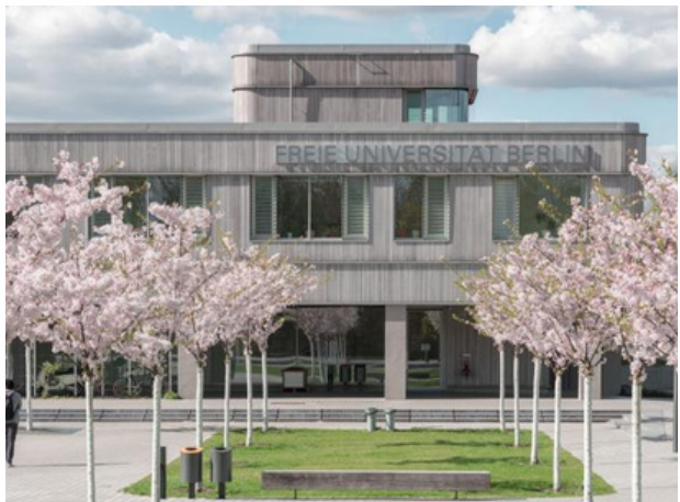
Université Freie - Berlin