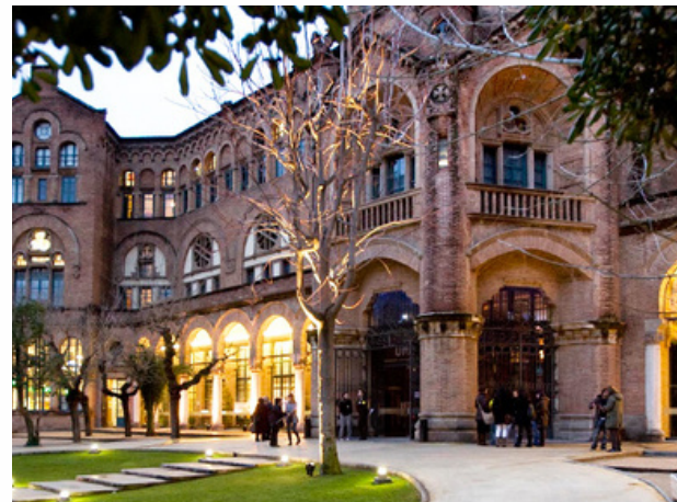
UAB - Barcelone