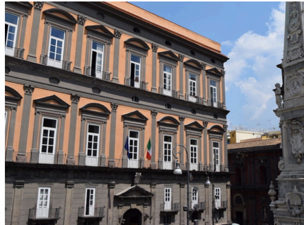
L'Orientale - Naples