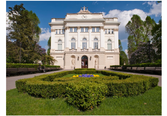
Université de Varsovie Varsovie - Pologne