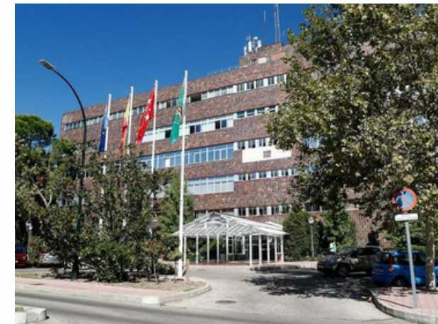
UAM - Madrid