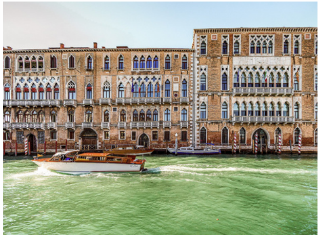
Ca'Foscari - Venise