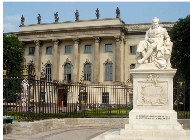
Humboldt - Berlin