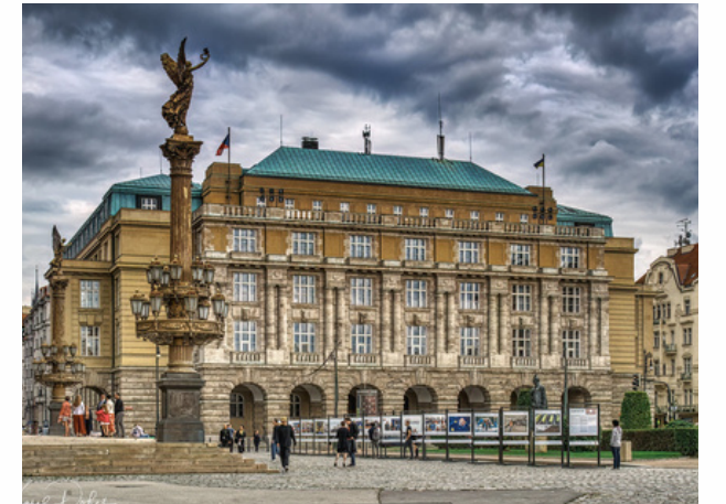
Université Charles Prague - République Tchèque