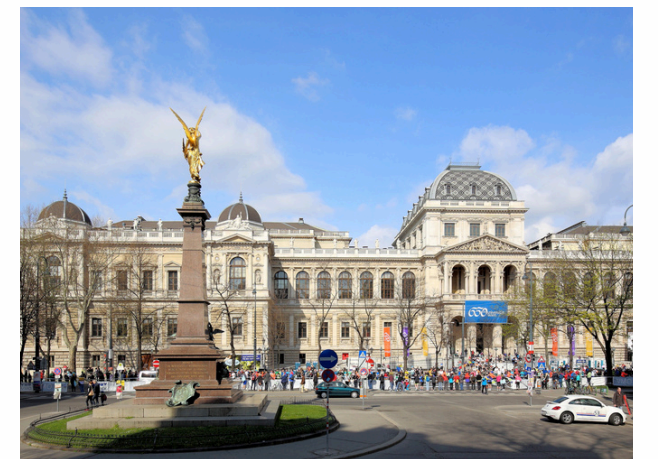
Université de Vienne Vienne - Autriche