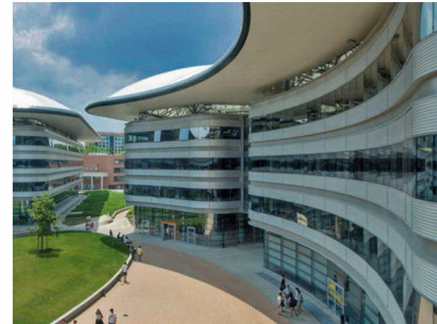
Université de Turin