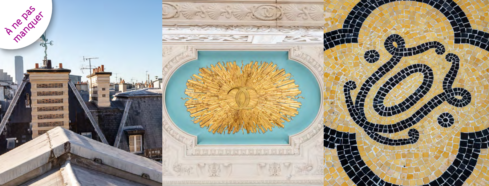
Maison de la recherche de l'Inalco