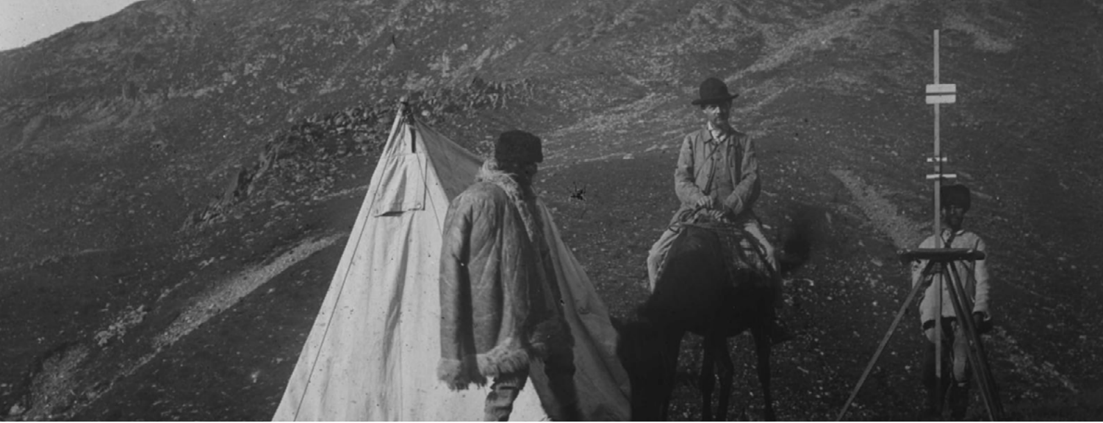
Pàringu, campement dans la montagne, vers 1900. EU3554-035