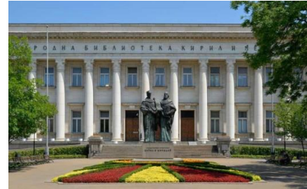
Bibliothèque nationale « Saints Cyrille et Méthode », Sofia.

Au IX e siècle, les événements et la clairvoyance politique de ses souverains ont permis au Royaume de Bulgarie d'accueillir les disciples des frères Cyrille et Méthode, créateurs des alphabets slaves, et d'être ainsi le berceau de la première langue littéraire slave et de la première littérature écrite dans cette langue – faite d'abord de traductions de textes sacrés et liturgiques, puis d'œuvres originales. À partir de là, elles allaient être diffusées en Serbie, dans la Russie de Kiev.