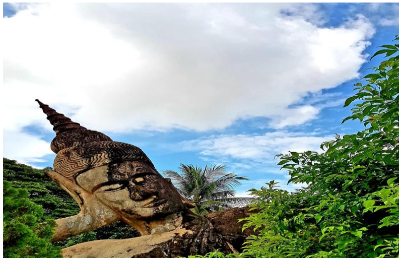
Vat Xiang Khuan, Viantiane