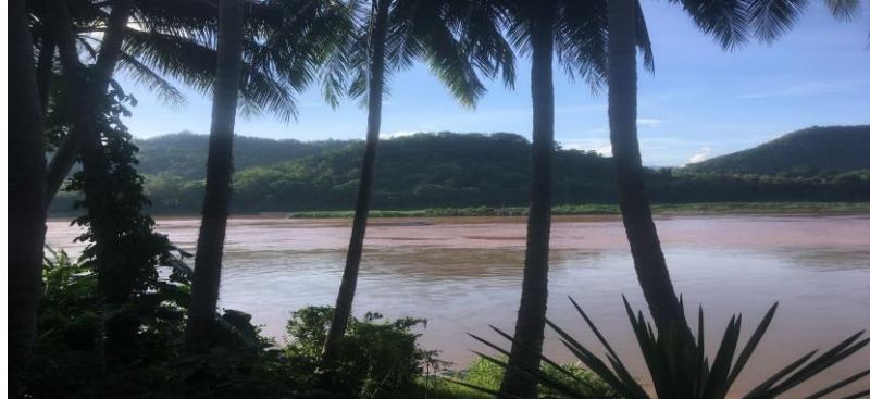
Vue sur le Mékong à Louang Phrabang