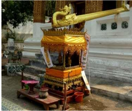
[Ondoiement des Bouddhas à l'occasion du nouvel an lao à Luang Phrabang]