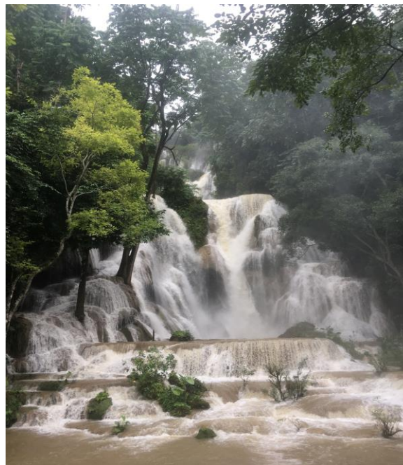
Les cascades de kuang Si Louang Phrabang