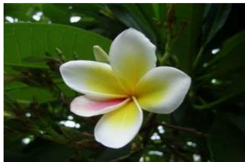
[Fleur nationale du Laos : le frangipanier]