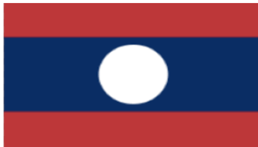
ທຸງຊາດລາວ

ປະເທດຂອ້ຍ ຊັ້ນຊື່ເມືອງລາວ ລວງກ້ວາງຍາວ ສດຕາເຫຼືອອ່ານ ນ້ຳຂອງຜ່ານ ໄຫຼຜ່າທາງກາງ.