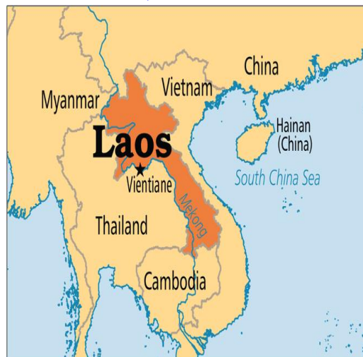
ແຜນທີ່ ປະເທດລາວ