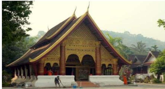
[Style de pagode à Luang Phrabang (Khamphanh Pravongviengkham)]