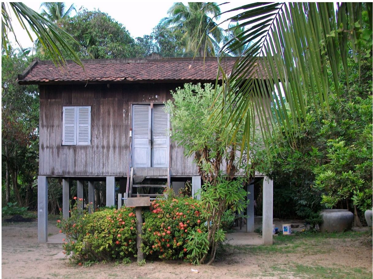
ផ្ទះអ្នកស្រុក ខេត្តពោធិ៍សាត់ ។ Maison villageoise, province de Pursat.

Dans ce parcours l'UE4 comporte chaque année un module de formation axé sur le monde de l'entreprise et l'accès au marché de l'emploi (semestres impairs) ainsi qu'un stage en entreprise (semestres pairs). Le parcours Cap emploi peut être intégré dès la L1. À l'issue de la L2, les étudiants peuvent soit poursuivre en L3 LLCER parcours Cap emploi, soit s'orienter vers la licence pro en alternance. (Voir la brochure spécifique à ce parcours Cap Emploi | Inalco ).