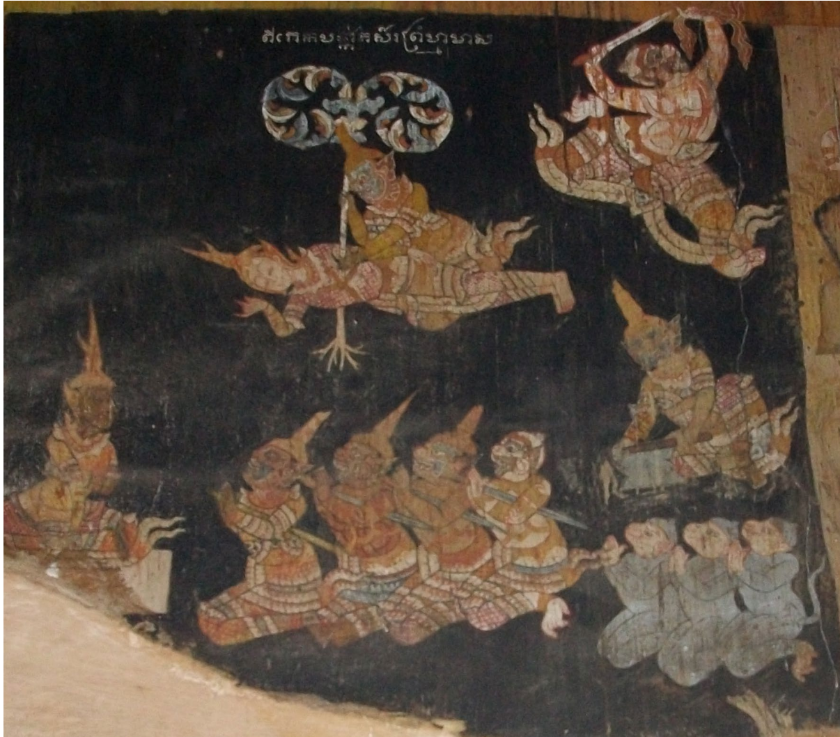
នូវរឿងរាមកេរ្តិ៍ វត្តរាជបូណ៌ ក្រុងសៀមរាប ។