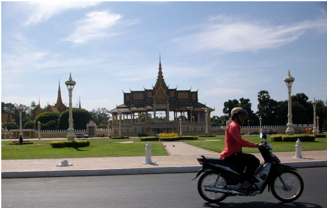
ព្រះទីនាំងចន្ទតាយា ព្រះបរមរាជវាំងចតុមុខ ក្រុងភ្នំពេញ ។ Pavillon Chanchhaya, palais royal de Phnom Penh.