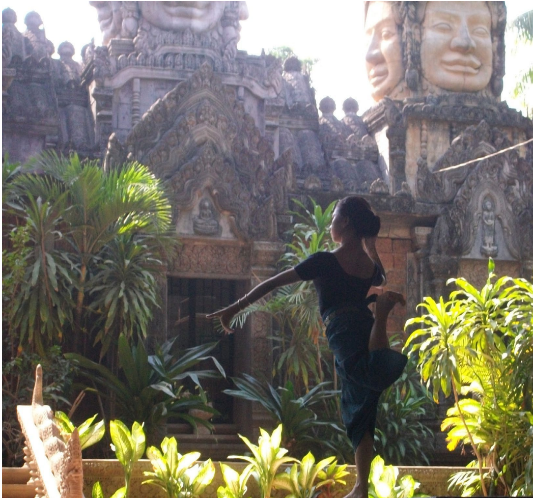
ការហាត់សមរាំ អង្គការសិល្បៈខ្មែរ(សុភីលីន) តាខ្មៅ ខេត្តកណ្តាល ។

Brochure non contractuelle, mise à jour du mercredi 24 juillet 2024. Des modifications sont susceptibles d'intervenir d'ici la rentrée.