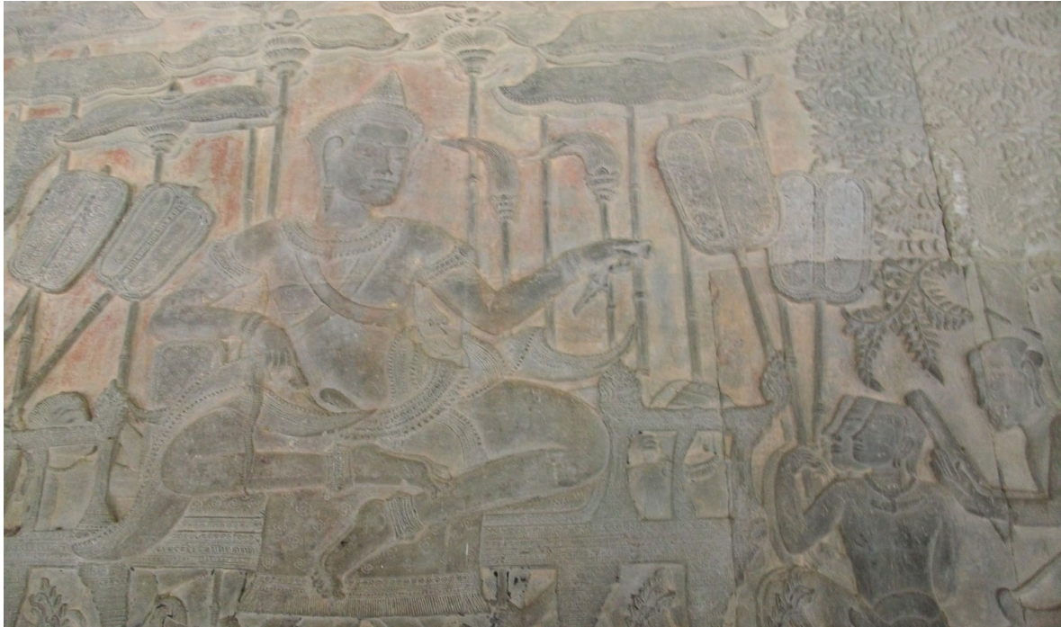
ផ្ទាំងចម្លាក់រូបព្រះបាទសូរ្យវរ្ម័នទេព ទី ២ ប្រាសាទអង្គរវត្ត ។

Bas-relief représentant le roi Sūryavarman II, temple d'Angkor Vat.