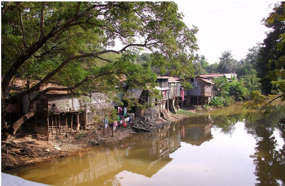
ស្ទឹងសៀមរាប ក្រុងសៀមរាប ។ Rivière de Siem Reap, ville de Siem Reap.