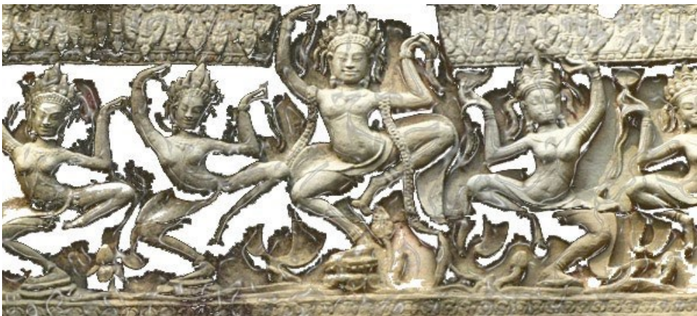
Vat Phnom, Phnom Penh (photo : Michel Antelme).