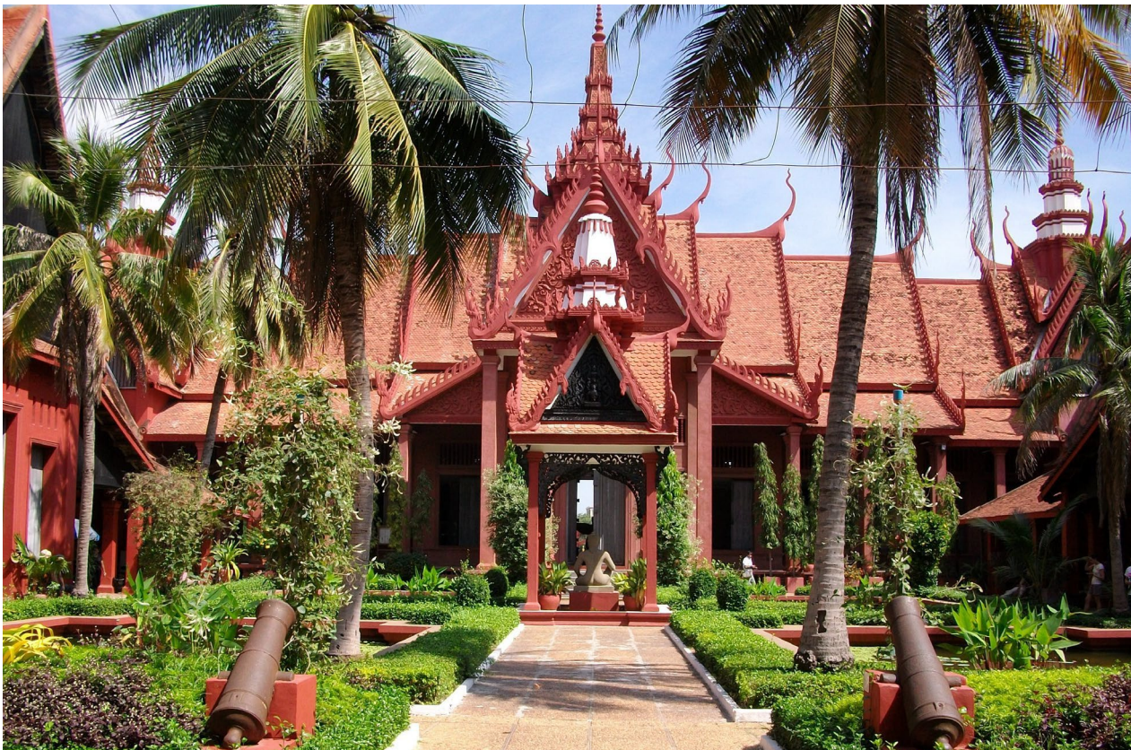
សារមន្ទីរជាតិកម្ពុជា ក្រុងភ្នំពេញ ។ Musée national du Cambodge, Phnom Penh.