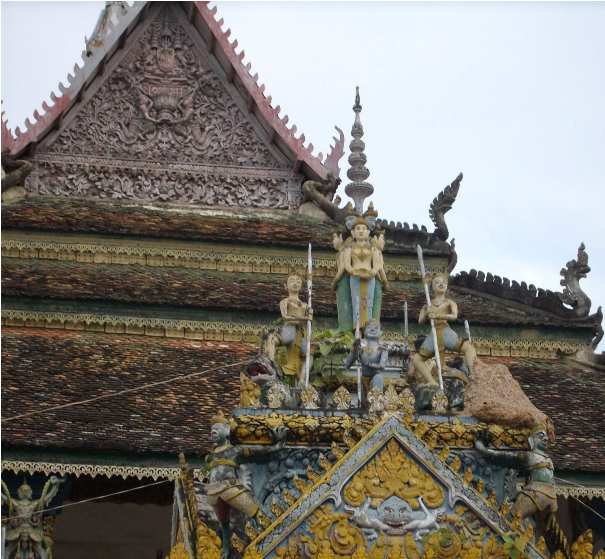
វត្តជំរីស ក្រុងបាត់ដំបង ។

Pagode Vat Dâmrey Sâ, Battambang (photo : Michel Antelme).