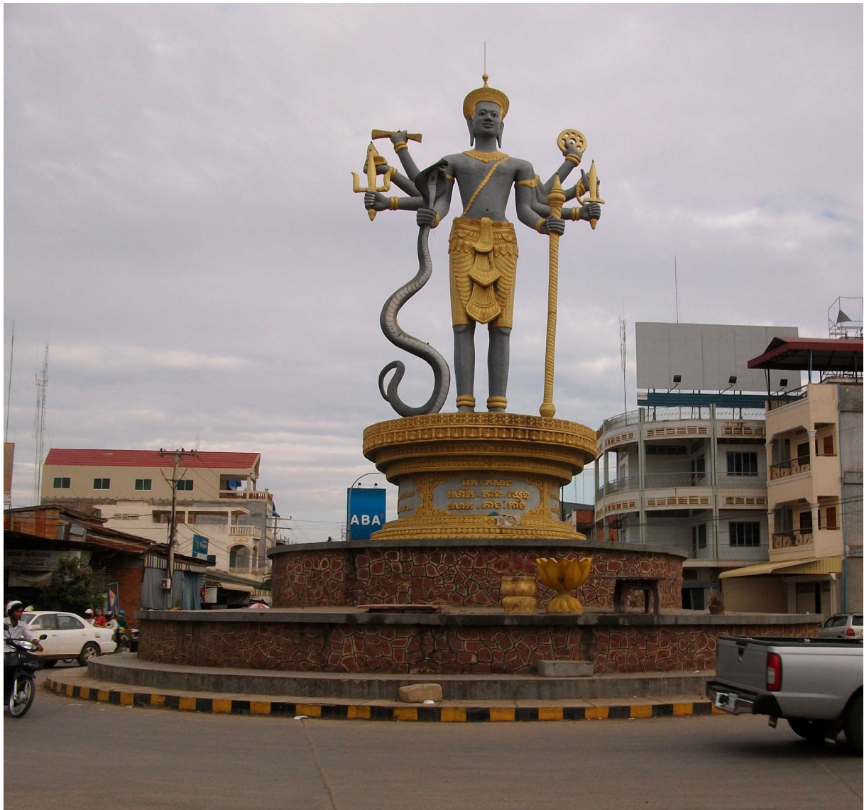
រូបព្រះឥសូរ ទីរួមខេត្តបាត់ដំបង ។ Statue de Śiva, Battambang-ville.